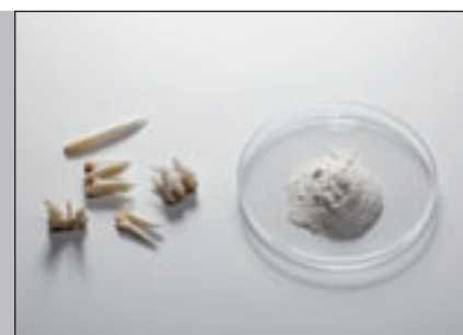
Зубы до и после измельчения с помощью FRITSCH PULVERISETTE 0