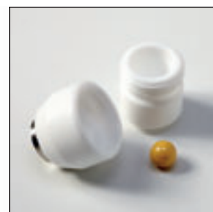
Стакан из тефлона (PTFE)

Ультра-компактная мини-мельница FRITSCH это идеальная помощница для тонкого измельчения самых малых количеств – в жидкой среде, а также всухую или криогенного. Ее специальные шарообразные размольные стаканы обеспечивают значительно более высокую эффективность при измельчении, смешивании и гомогенизации, чем у сравнимых моделей. Занимая площадь всего лишь 20 x 30 см и имея вес в 7 кг, она бесппроблемно помещается повсюду, хорошо смотрится, особенно доступна в управлении и обслуживании, доступна по цене и убеждает отличными результатами: маленькая, быстрая, эффективная.