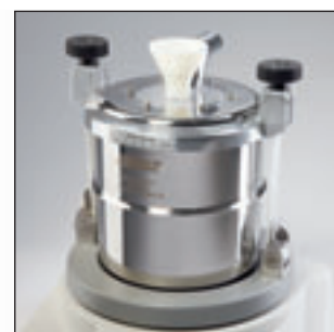
Сосуд FRITSCH Kryo-Box для быстрого, простого охрупчивания

Мельница FRITSCH PULVERISETTE 0 это идеальная лабораторная мельница для тонкого измельчения среднетвердых, хрупких, влажных или чувствительных к температуре проб – в сухой среде или в суспензии – а также для гомогенизации эмульсий и паст.