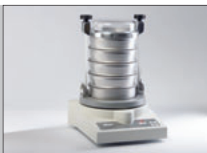
Мельница и Виброгрохот в одном приборе