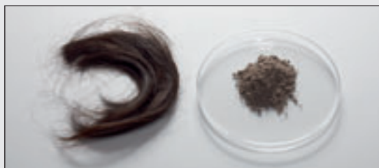
Проба волос – до и после измельчения с помощью PULVERISETTE 23

Для быстрой и простой подготовки проб волос для исследования на наличие наркотиков в мини-мельнице FRITSCH PULVERISETTE 23 примерно 300-500 мг волос при помощи стального шара 15 мм в стальном стакане 15 мл за 5 минут можно измельчить в тончайший порошок (< 100 мкм).