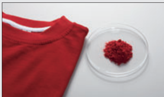
Брикетированные элементы из KBr для исследования проб волокон

Для исследования волокон при помощи инфракрасной спектроскопии мельница PULVERISETTE 23 обеспечивает идеальную подготовку пробы для создания гомогенных брикетированных элементов из бромида калия (KBr). При добавлении 20 мг KBr она за 3 минуты измельчает пробу в гомогенный порошок. При добавлении еще 250 мг KBr, который в течение 90 секунд также был измельчен в PULVERISETTE 23, измельченная проба в течение 30 секунд продолжает измельчаться и гомогенизироваться.