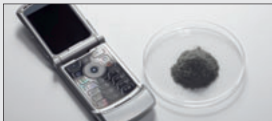
Клавиатура сотового телефона: результат измельчения после охрупчивания в условиях заморозки

Для измельчения отдельных электронных компонентов, например, сотовых телефонов для анализа по RoHS, вибрационная микромельница FRITSCH PULVERISETTE 0 – в зависимости от свойств пробы при комнатной температуре или при криогенном измельчении после охрупчивания жидким азотом в практичном сосуде FRITSCH Kryo-Vox – показывает очень хорошие результаты.